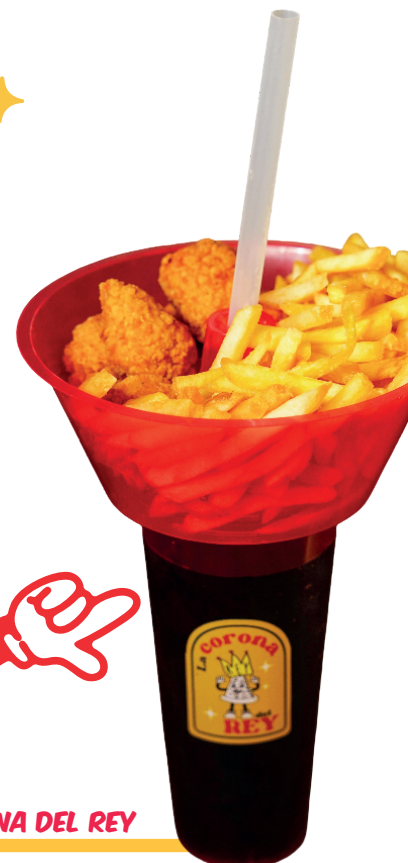
LA CORONA DEL REY